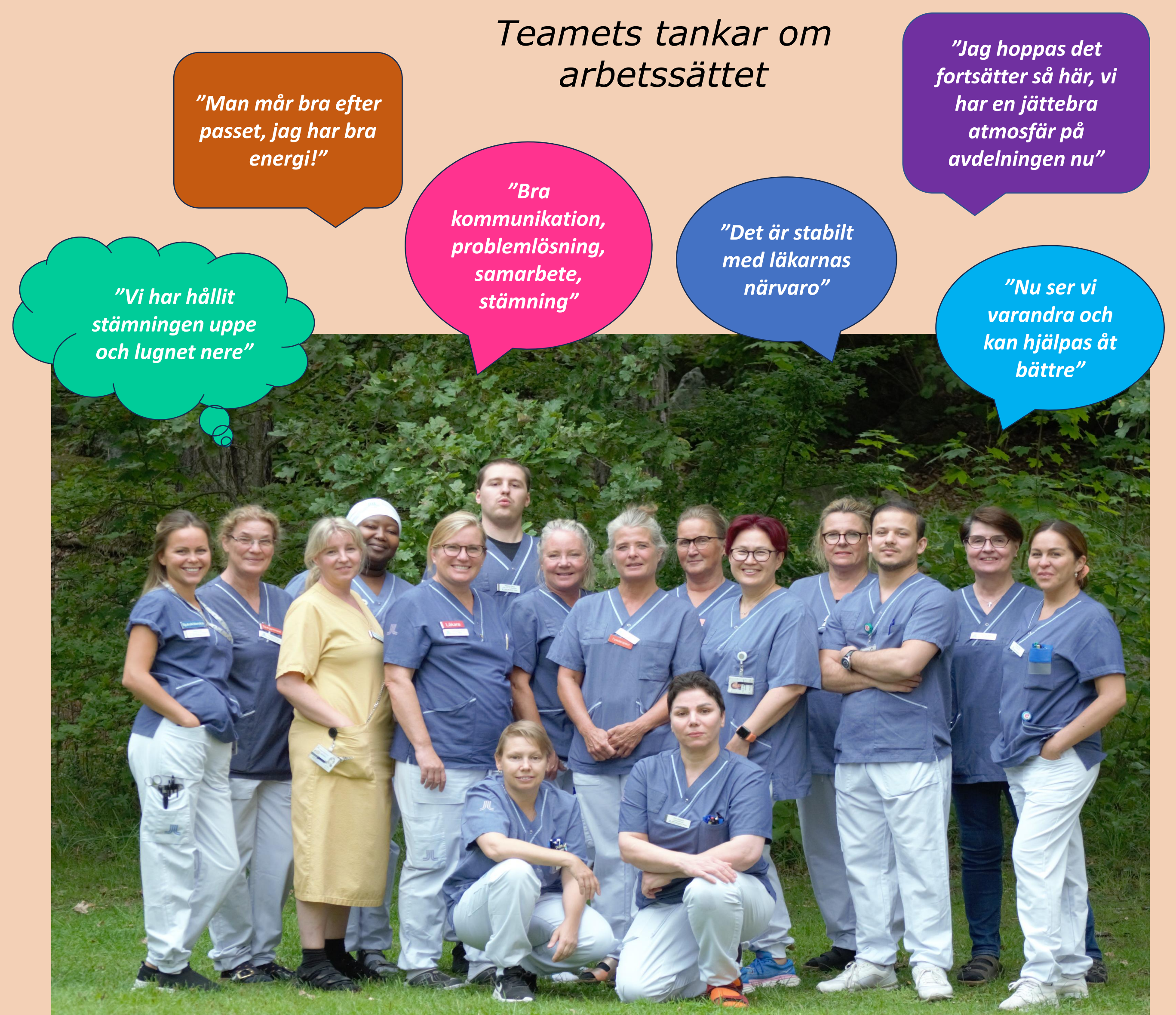
En del av vårt multiprofessionella team på den specialiserade palliativa vårdavdelningen, Långbro Park